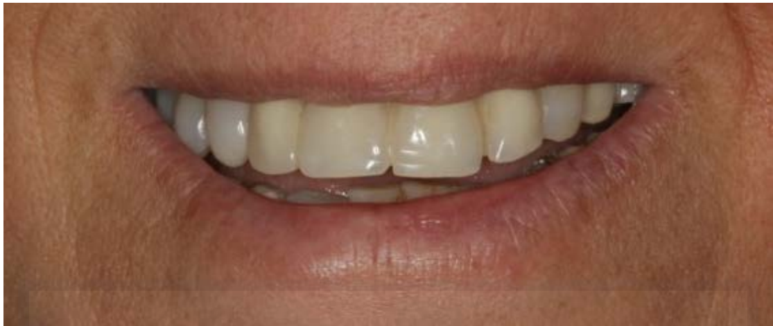
Sorriso dopo, visione frontale.