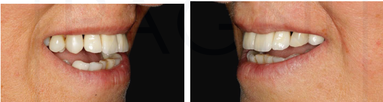
Sorriso dopo. Visioni laterali.