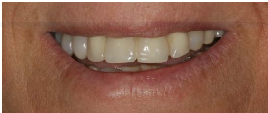
Sorriso dopo, visione frontale.