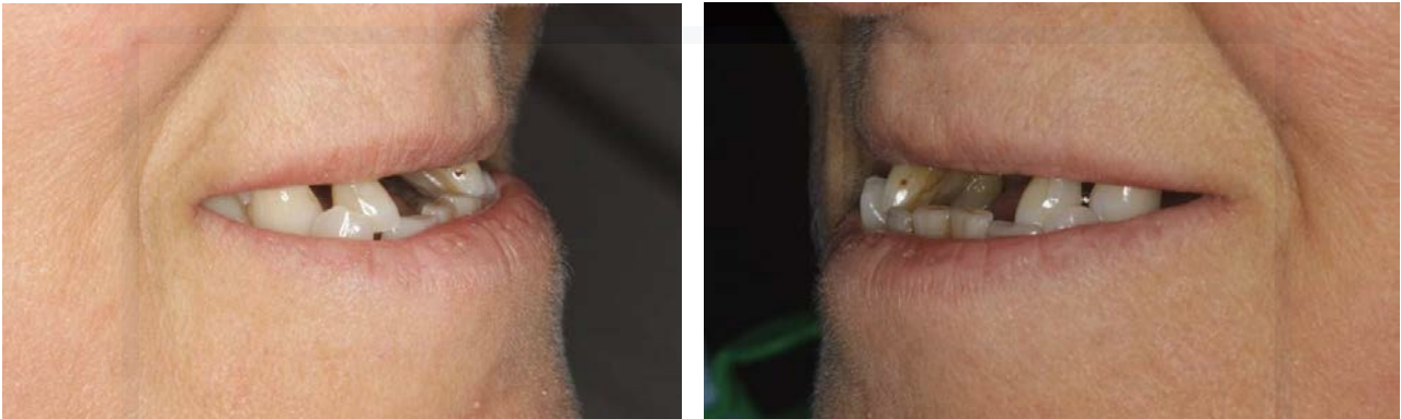
Sorriso prima: visioni laterali.

Destra: dettaglio dopo. Riabilitazione fissa, con protesi in ceramica-zirconio su denti e impianti, con parziale correzione del morso invertito.