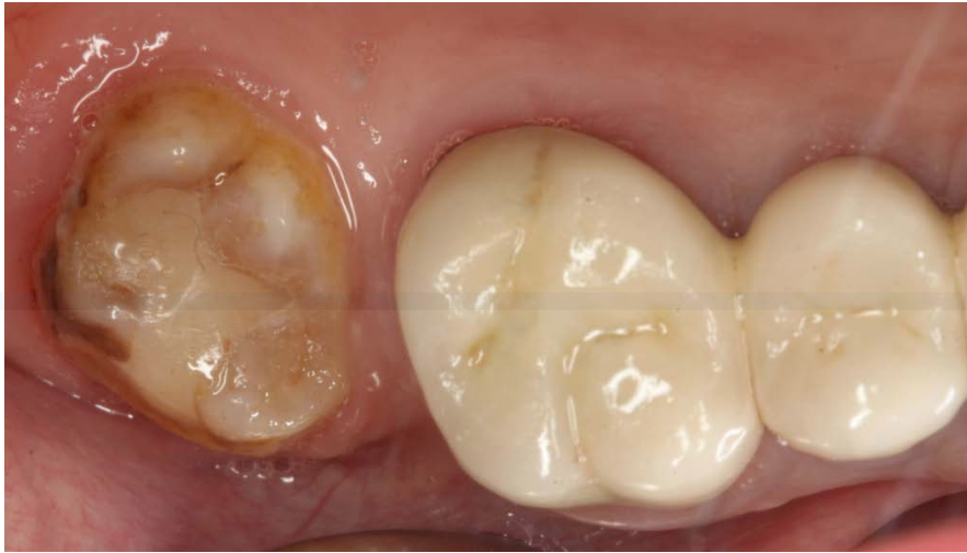
Un dente del giudizio erotto a 71 anni!

inclusi) vedi Terapie: Estrazione del dente del giudizio, il numero finale sarà di 32 denti.